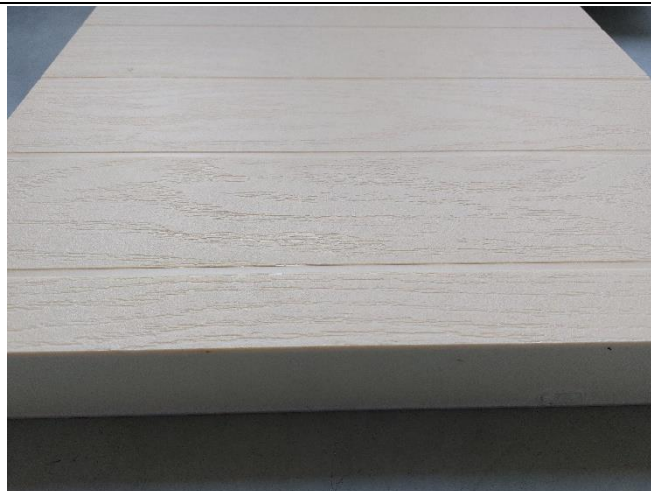
Figure 1: Picture of the received sample