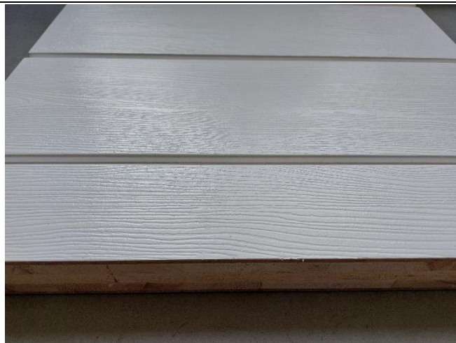
Figure 1: Picture of the received sample